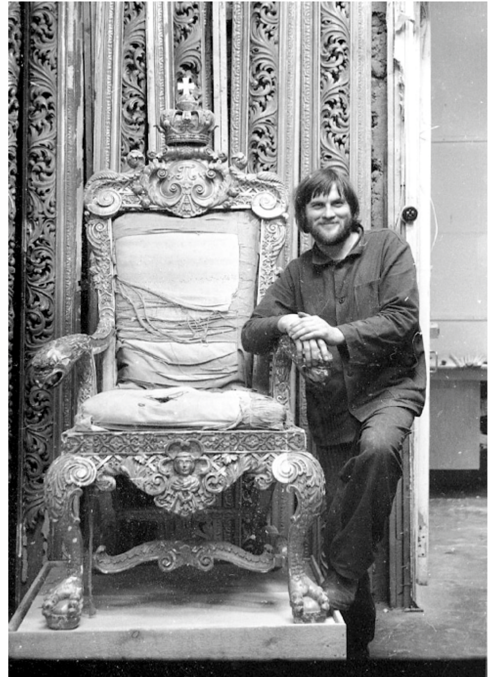
Илл. 8. Тронное кресло императора Павла I перед реставрацией. Реставратор В. Д. Васильев. 1985 г. Фото С. Брижака. ГМЗ «Гатчина».