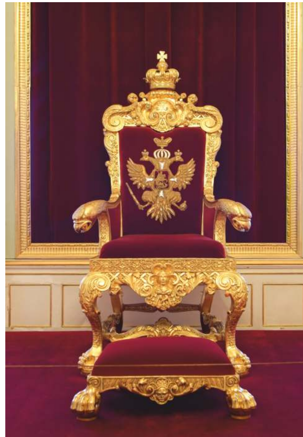
Илл. 9. Верхняя Тронная Павла I. Трон с подножной скамейкой. Фото 2012 г. ГМЗ «Гатчина».