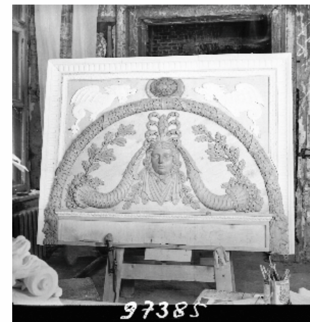
Илл. 6. Лидия Алексеевна Стрижова – скульптор-модельщик.