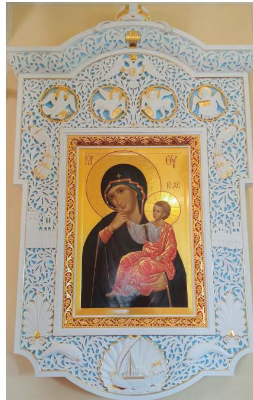
Илл. 11. Киот резной для иконы «Отрада и утешение». Автор иконы Г. В. Гашев, резчик В. Д. Васильев. Фото 2023 г. ГМЗ «Гатчина».

Нижняя часть киота представляет собой сюжет, связанный с кораблекрушением. Там мы видим изображение раковины (символ Богородицы) и корабля (христианский символ спасения). Резное кружево символизирует волны, морскую пену. По бокам – два дельфина, соединяющих две стихии – воду и воздух. «Символ дельфина использовался в раннехристианском искусстве по преемству из языческого для обозначения души человека или служебной ангельской силы как в аллегорических композициях по античным мотивам, так и в христианских сюжетах» 14 . Второй смысл изображения дельфинов – это дофин, то есть царевич, наследник. Боковые части киота символизируют сушу с произрастающими на ней пальметами – символами воскресения. На левой части рамы Ватопедский монастырь на Афоне, а на правой – храм, где хранится икона «Отрада и утешение». Выше – фигуры павлинов, обозначающих в Византийской традиции вечную жизнь. В верхней части киота – тетраморфы 15 – символы