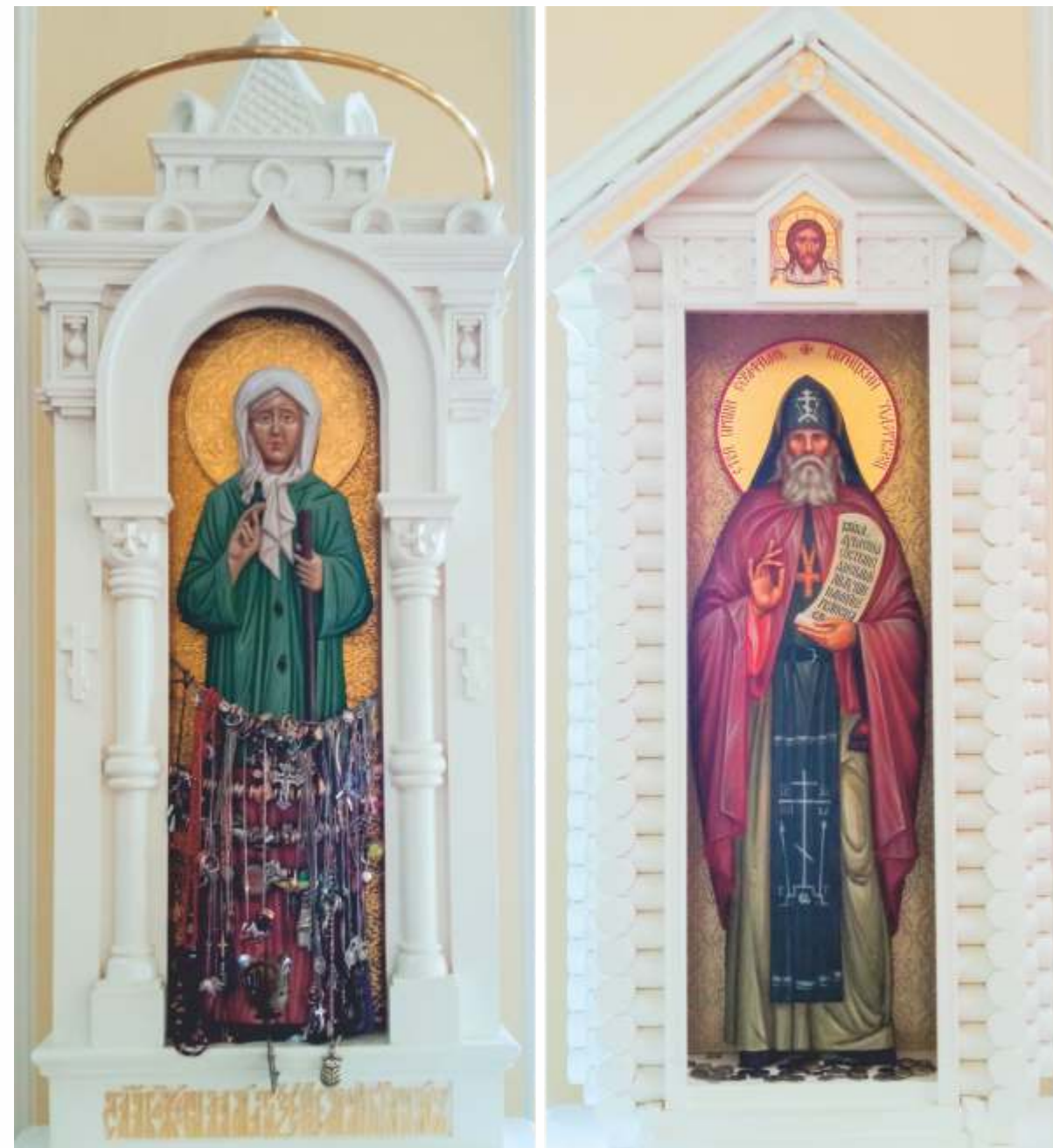
Илл. 10. Резные иконы святых Ксении Петербургской и Серафима Вырицкого. Резчик В. Д. Васильев. Фото 2023 г. ГМЗ «Гатчина».

13 Всего В. Д. Васильевым выполнено шесть резных образов святого Серафима Вырицкого. Один из них подарен мастером настоятелю храма Полоцкого Спасо-Евфросиньевского монастыря.