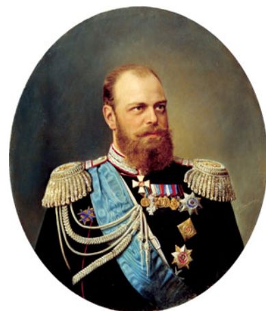
Александр III 1896 г.

Количество баллов за правильный ответ: 1