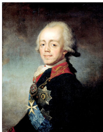
Павел I 1796 г.