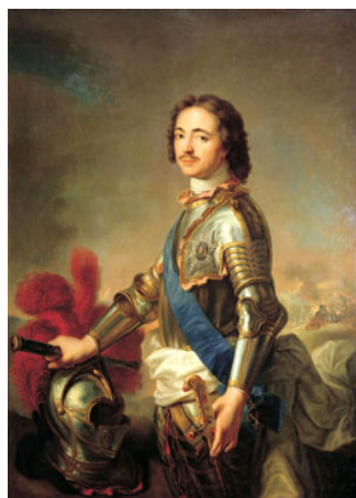
Петр I 1796 г.

14. Когда и кем был утвержден герб города Гатчина?