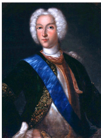
Петр II 1709 г.